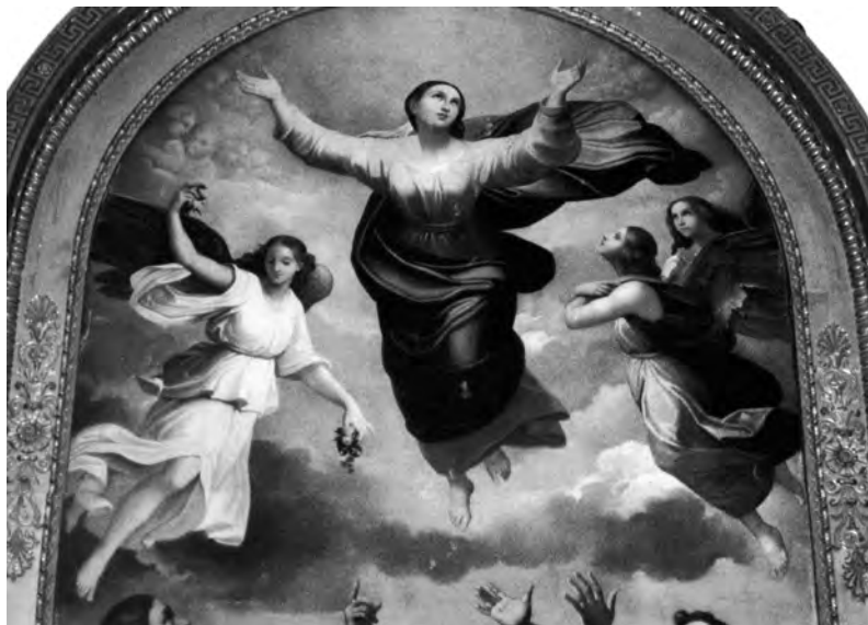
Fig. 13. Filippo Agricola, Vergine ascendente e angeli (particolare dall' Assunzione della Vergine ), 1838, olio su tela, cm. 585x309 ca, Roma, Basilica di San Paolo fuori le Mura - Pinacoteca (foto dell'A. su concessione dell'Abbazia di San Paolo fuori le Mura).

anche l'iconografia del Cristo e la trasferisce in quella della Madonna. Infatti non soltanto ripete il gesto delle braccia aperte e bil movimento delle gambe nella salita, ma anche l'idea del drappo della veste fluttuante nell'aria.