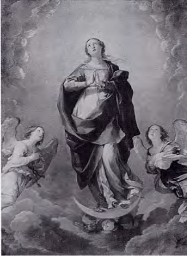
Fig. 17. Guido Reni, Immacolata Concezione , 1627, olio su tela, cm. 268x185,4, New York, Metropolitan Museum (da: V. Garibaldi - F.F. Mancini (a cura di), Perugino il divin pittore , Cinisello Balsamo (Mi) 2004, p. 395).

Il pittore romano, quindi, desume dal Vannucci vari suggerimenti, li assembla e li organizza in un'ottica corrente.