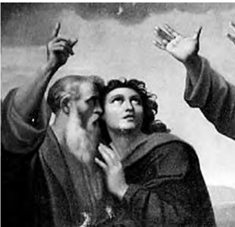
Fig. 6. Filippo Agricola, Apostolo (particolare dall' Assunzione della Vergine ), 1838, olio su tela, cm. 585x309, Roma, Basilica di San Paolo fuori le Mura - Pinacoteca (foto dell'A. su concessione dell'Abbazia di San Paolo fuori le Mura).