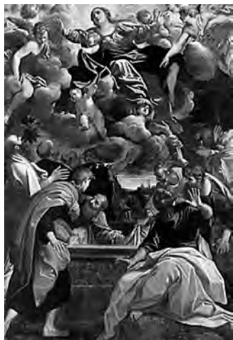
Fig. 10. Annibale Carracci, L'Assunzione della Vergine (Pala Bonasoni), 1592, olio su tela, cm. 260x177, Bologna, Pinacoteca Nazionale (da: D. Benati - E. Riccomini (a cura di), Annibale Carracci , Verona 2006, p. 253, tav. V. 9).

Inoltre, nella formazione del codice espressivo di un pittore classicista, non poteva essere trascurata la tradizione accademica bolognese il cui carattere cosmopolita le permetteva di essere molto apprezzata. Della cultura pittorica emiliana, infatti, era particolarmente lodata la capacità di rendere “più vivo”, o per meglio dire più vero, un dipinto, in opposizione alla concezione di imitazione dei modelli consacrati (Leonardo, Raffaello, Michelangelo) di area centro-italiana.