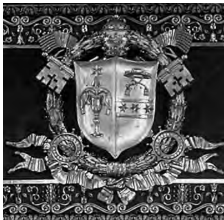
Fig. 1. Arma di Gregorio XVI , legno intagliato e dorato, Roma, Basilica di San Paolo fuori le Mura - soffitto del transetto (da: A.M. Cerioni - R. Del Signore, La Basilica di San Paolo Fuori le Mura , Roma 2003, p. 31).

La pala era stata allogata all'artista romano per disposizione di Gregorio XVI, con dispaccio di Segreteria di Stato l'8 giugno 1832. L'Agricola avrebbe dovuto realizzare la tela per uno dei due altari di testata della navata trasversa, più esattamente quello verso il monastero 7 . Il pontefice aveva stabilito inoltre il compenso del lavoro in seicento Luigi d'oro da rimettere all'artista in tre rate da duecento Luigi ciascuna 8 .