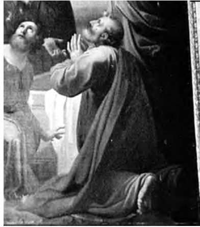
Fig. 5. Filippo Agricola, San Pietro, (particolare dall' Assunzione della Vergine ), 1838, olio su tela, cm. 585x309 ca, Roma, Basilica di San Paolo fuori le Mura - Pinacoteca (foto dell'A. su concessione dell'Abbazia di San Paolo fuori le Mura).