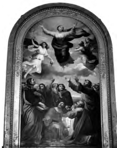
Fig. 3. Filippo Agricola, Assunzione della Vergine , 1838, olio su tela, cm. 585x309 ca, Roma, Basilica di San Paolo fuori le Mura - Pinacoteca.

così era divenuto il simbolo della pittura nuova, laica e religiosa, inevitabile e insostituibile persino per i barocchi oltre che ovviamente per ogni forma di rinascite classicismo in pittura 20 .