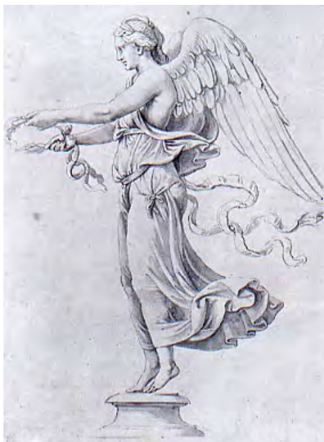
Fig. 14. Giulio Romano, Vittoria , 1530, disegno a penna, Vienna, Graphische Sammlung Albertina (da: P. De Vecchi - E. Cerchiari, Arte nel tempo. Dalla crisi della Maniera al Rococò , II, San Giuliano Milanese (Mi) 1995, p. 484, tav. III, 43).

di riferimento al Perugino, che dipinge angeli dalle braccia divergenti rivestiti di abitini leggeri all'“antica”, gonfiati dal vento, le cui maniche a sbuffo, vengono reinterpretate in chiave più moderna.