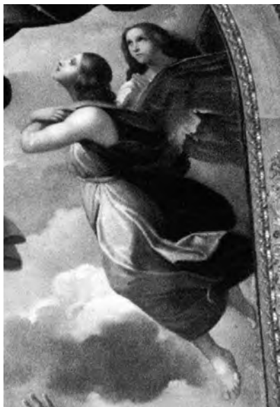
Fig. 18. Filippo Agricola, Angelo (particolare dall' Assunzione della Vergine ), 1838, olio su tela, cm. 585x309 ca, Roma, Basilica di San Paolo fuori le Mura - Pinacoteca.

accademico di San Luca dai modi pittorici poco innovativi, ha quasi totalmente ignorato l'analisi della sua produzione artistica, non riconoscendo sufficientemente al cavaliere Agricola quel ruolo e importanza storica che ebbe nell'ambito della Scuola romana.