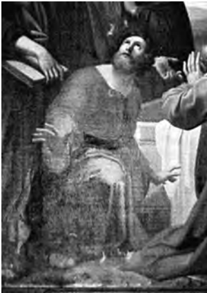
Fig. 12. Filippo Agricola, Apostolo (particolare dall' Assunzione della Vergine ), 1838, olio su tela, cm. 285x309 ca, Roma, Basilica di San Paolo fuori le Mura - Pinacoteca.

Il cavalier Agricola imposta allo stesso modo la composizione della parte superiore della sua pala, nella quale Maria ascende al centro fra i due angeli in primo piano. L'Agricola trae da Raffaello