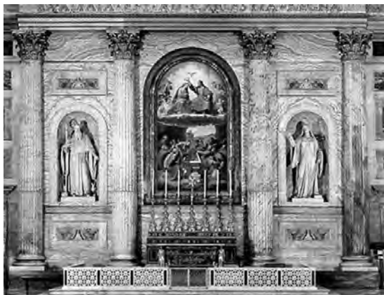
Fig. 20. Studio del Mosaico Vaticano, Pala di Monteluca (replica musiva), 1874 ca, mosaico, Roma, Basilica di San Paolo fuori le Mura - transetto (da: A.M. Cerioni - R. Del Signore, La Basilica di San Paolo Fuori le Mura , Roma 2003, p. 31).

di Raffaello (fig. 20) 39 . L'opera fu temporaneamente collocata nell'ambiente del fonte battesimale nel quale erano state poste altre opere provenienti dall'area della basilica. Essa fu ubicata al posto della tela raffigurante l'Apocalisse di San Giovanni la quale fu invece trasferita nel Monastero. In un momento successivo, non